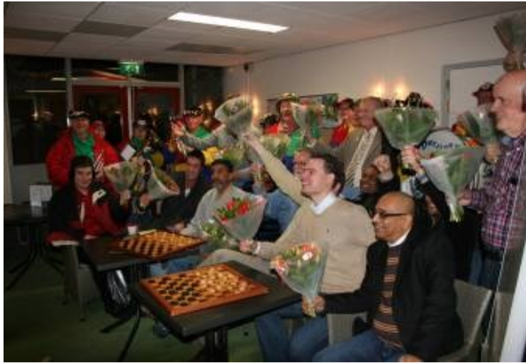
CTD promoveert naar de Ereklasse

Tot voor kort was ik lid van twee damverenigingen. Het clublokaal van damclub CTD ligt op ongeveer 1 kilometer van mijn woning; damclub VBI is 6 kilometer verder in Huissen gevestigd. In 2001, toen ik in Arnhem kwam wonen, meldde ik me bij Huissen aan, een paar jaar later ging ik de jeugdafdeling van CTD leiden en werd ik ook daar lid. Nu ik het wat rustiger aan doe en de opleiding van jeugddammers aan anderen overlaat, heb ik het lidmaatschap van CTD opgezegd.