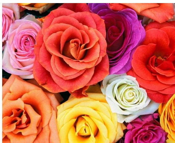
CTD'ers: veel succes volgend jaar in de Ereklasse

10. De laatste zetten waren 37-32 en (31-36). Wit wint nu door 38-33(36x29)39-34- een aardige manier om een zwart stuk op 23 te krijgen- (27x38)16x18(12x23)48-43(38x49)26-21(49x24)21x1(29x40)1x9!(4x13)15x4. Opnieuw komt er een motief van de Limburgse motivist op het bord: (19-23)4x29(40-44)45-40,29-7.