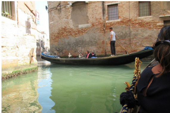
Venetië- in een van de vele grachten.

wel 400 euro zou kosten. Voor de passagiers in de gondel had de boze man verder geen aandacht meer.