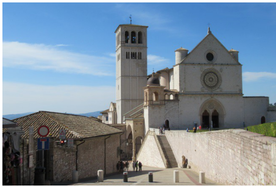
De kerk van Sint-Franciscus in Assisi