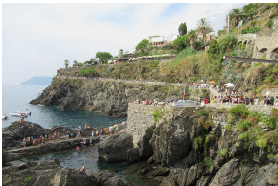
Een van de markante dorpjes van Cinque Terre aan de Ligurische kust (de kuststrook tussen Genua en La Spezia)

Cinque Terre was voor ons een openbaring. Toen ik ruim dertig jaar geleden in dezelfde omgeving rondzwierf, waren deze vijf tegen de rotsen aangeplakte dorpen nog nauwelijks bekend als bezienswaardigheden, maar nu zag het er zwart van de toeristen. In juli en augustus moet dat nog erger geweest zijn. Met een boot die vanuit La Spezia vertrok, voeren we langs de prachtige kust. We deden drie van de vijf schilderachtige dorpjes aan en reisden vanuit het vijfde dorp met de trein naar de marinestad La Spezia terug.