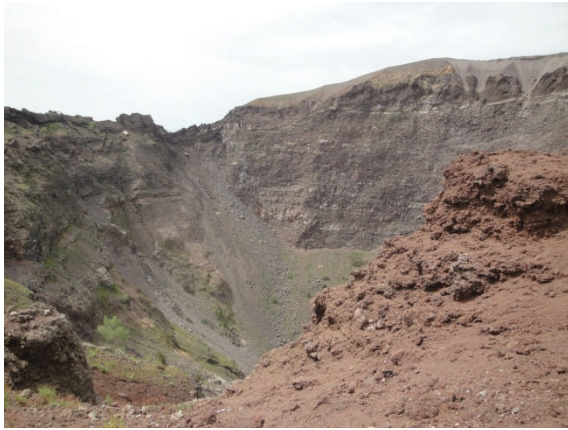
De krater van de Vesuvius

stopte die vervolgens weer weg in haar portefeuille. Kennelijk had een slimme zakkenroller dat gezien. De volgende morgen merkte ze dat de portefeuille met haar paspoort was verdwenen (gelukkig zaten haar portemonnee en de betaalpasjes in een ander vakje van haar handtas). Het was een schrale troost dat de carabinieri ons geweldig goed heeft geholpen. Kennelijk hadden ze ervaring met dit soort problemen. Heel speciaal was voor ons het bezoek aan de krater van de Vesuvius. Foto 2 toont u de verwoester van Pompeï en Herculaneum.