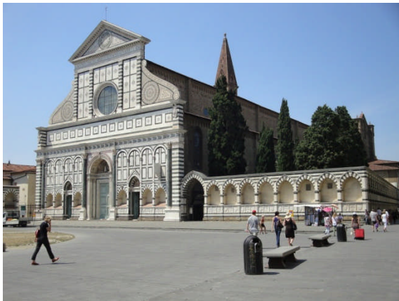
De Santa Maria Novella in Florence

Wie Florence wil bezoeken en kiest voor een reis met caravan of tent, kan ik aanraden om naar het noordelijker gelegen Barberino (in de streek Mugello) uit te wijken. Vorig jaar hadden we daar goede ervaringen opgedaan. Toen we op de camping aankwamen, werden we onmiddellijk herkend en dat leidde tot een uitgebreide knuffelpartij door de 'moeder' van de camping. Even later verscheen de baas (haar zoon) ten tonele. Bijna had ik hem gevraagd of hij al een Guerraprobleem had gemaakt, want de man leek sterk op de Nederlandse problemist Jaap de Wit. Alleen had deze vriendelijke man bruine ogen en was hij een jaar jonger en zeker tien kilo zwaarder dan zijn Nederlandse pendant. Vorig jaar toonde ik u op deze site de beroemde Ponte Vecchio; nu laat ik u de St. Maria Novella zien, een kerk die licht wordt vergeten en in de schaduw blijft staan van de beroemde Dom.