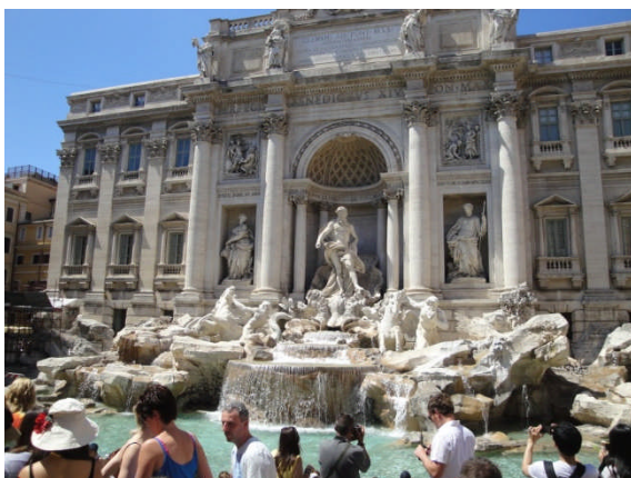
De Trevi-fonteinen in Rome

Ik heb altijd beweerd dat Florence de mooiste stad van de wereld is. Wie van kunst uit de Renaissance houdt, kan zijn ogen nauwelijks geloven. Maar toen we in deze vakantie een week door Rome hadden gezworven, wist ik het niet zo zeker meer. Was toch Rome de mooiste? Rome kent een rijke afwisseling van allerlei stijlen en tijdperken. Je moet soms wel verre wandelingen maken. Deze keer laat ik u geen foto zien van de Sint Pieter of van het Colosseum. Ik neem u mee naar de Trevi-fonteinen. Misschien kan het beschouwd worden als een kitscherig geval, zoals de Baroktijd in schilder- en beeldhouwkunst (anders dan in de muziek) vaak al te overdadig aandoet, maar de fonteinen spuiten daar tot volle tevredenheid van alle kitschminnaars.