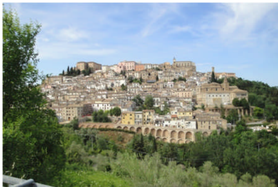
Gezicht op Loreto

(11x42) 26-21 (16x27) 36-31 (27x36) 49-43 (38x49) 47x7 (b.v.36x47) 25-20 (1x12) 50-44 (49x40) en nu de standaardreactie 20-15 (47x20) 15x2 (35x24) 2x25 met naturel op het gewenste veld. Mocht u ooit in de buurt van Pescara komen, dan kunt u de stad zelf rustig overslaan. Alleen de haven en de boulevard zijn de moeite waard, maar dan moet u eerst de auto zien kwijt te raken. Ons lukte dat niet. Het Apennijnse achterland is echter zeer de moeite waard en stadjes als Atri, Loreto, Penne en de provinciehoofdstad Termoli moet u zeker bezoeken. De eerste foto laat een uitzicht op Loreto zien.